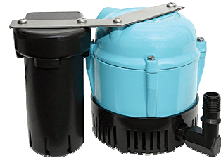
Modell 1ABS - überflutbar