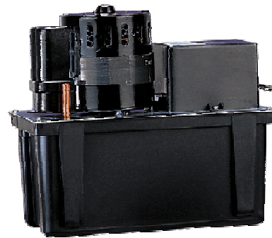
Modell VCL-45S Bis max. 26 Liter/Minute und max. 10 m Förderhöhe

Modell 1-ABS: Tauch- Kondensatpumpe, für Kondens- und Sickerwasser, ph-Wert 5,6-8, auf Wunsch mit Sammelbehälter. Ausgerüstet mit Schwimmerschalter - die Pumpe ist überflutbar (Tauchpumpe), max. Temperatur 45°C.