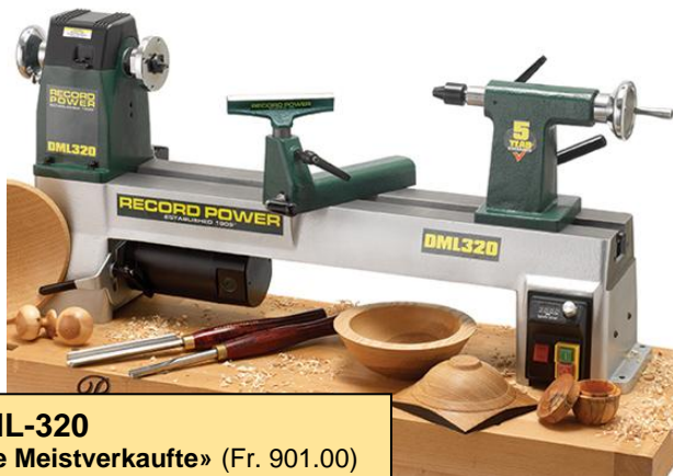
DML-320 «die Meistverkaufte» (Fr. 901.00) Aktion: Fr. 845.00

Massive Gusskonstruktion und somit hohe Laufruhe, ab dem Einsteigermodell DML-250