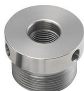
Gewinde-Einsatz für SC1 und SC4 Spannfutter (M33; M18, M20 etc.)

Das SC1 hat einen sehr kompakten Körper von 53,5 mm im Durchmesser (Höhe: 70 mm) und ist somit ideal für das Drehen von sehr kleinen und komplizierten Teilen. Spannbereich: 29-39 mm / Spreizbereich: 39-49,5 mm Preis: Fr. 85.00 Aktion: Fr. 73.00