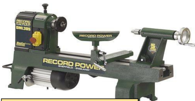
DML-305-M33-EP (Fr. 473.00) Aktion: Fr. 451.00