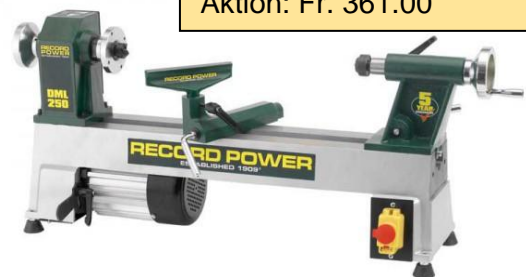
DML-250 «das Einsteigermodell» (Fr. 383.00) Aktion: Fr. 361.00

Alle Preise inkl. 8,1 % MWST – Preis- & Modelländerungen vorbehalten, Oktober 2024